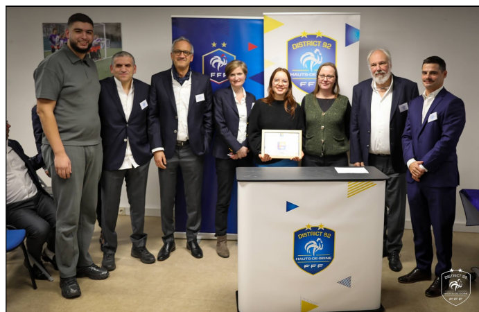
Fonds Louis-Gaston Payet, appel à projet 2025